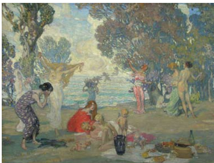
J. ROZENTĀLS „Arkādijas dārzs” (fragments) 1910.