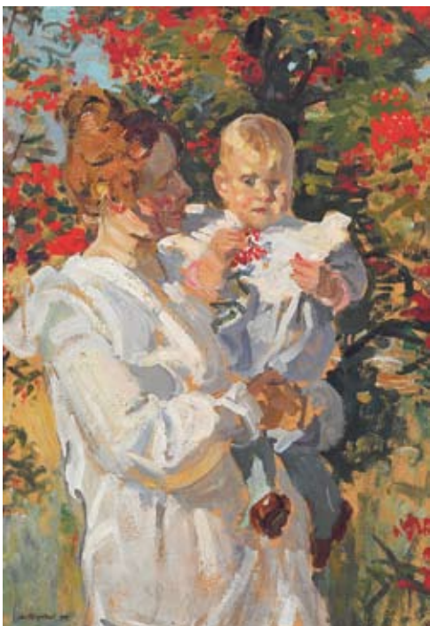
J. ROZENTĀLS „Zem pīlādža” 1905.

Vai tas varētu būt viens un tas pats dārzs, notikums un laiks? Kas tev liek tā domāt?