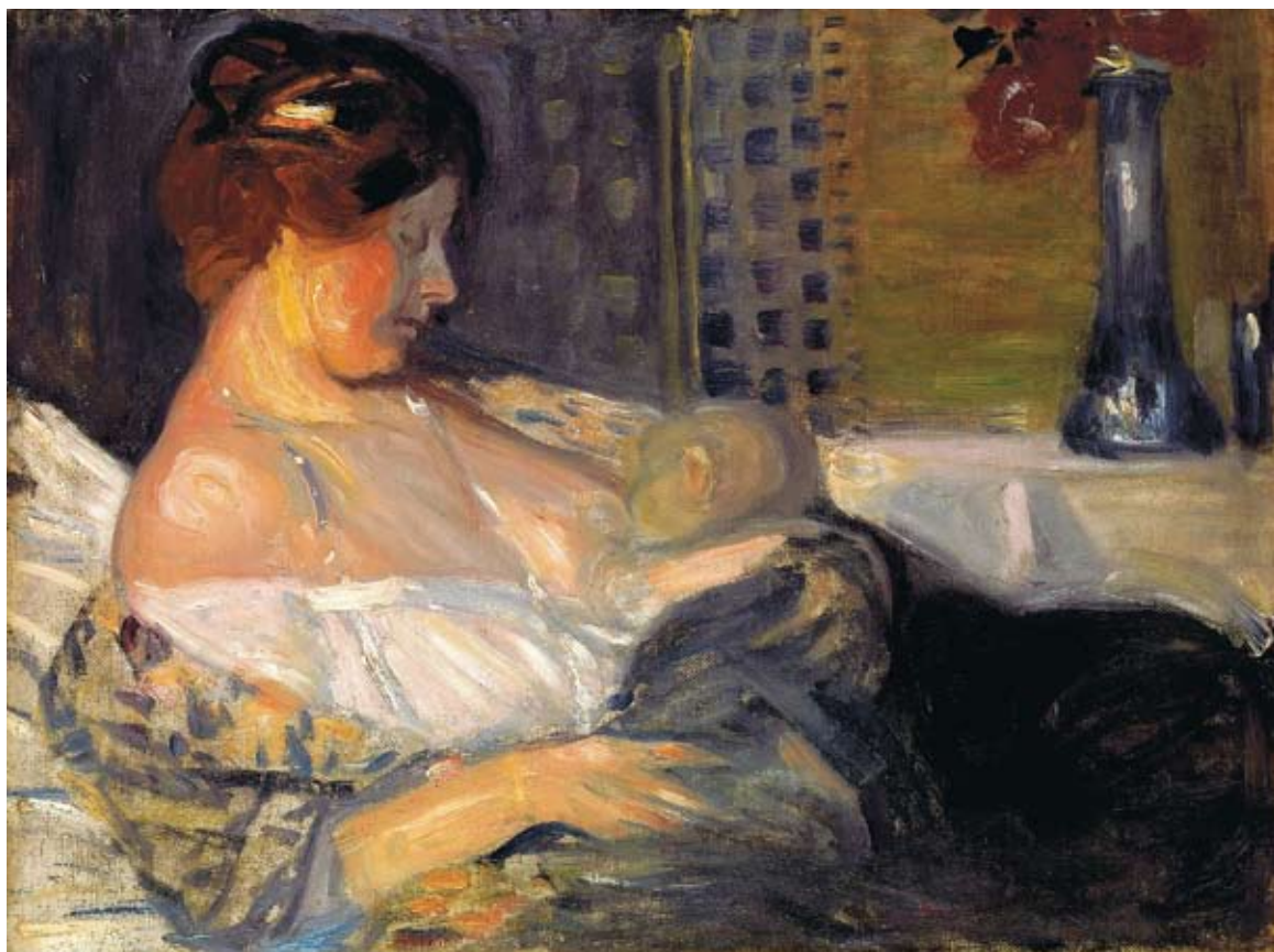
J.ROZENTĀLS „Māte ar bērnu” 1904.

Katrai gaismai ir sava krāsa un noskaņa. Tā mainās atkarībā no gaismas avota. Svece rada siltu, noslēpumainu gaismu. Līdzīgi kā tava istaba arī glezna kļūst mājīgāka, kad tajā spīd sveces. Viss izskatās tumšs, krēslains – tādejādi radot mistisku noskaņu. Savukārt spilgta lampa vai saule rada izteiktus gaismu un ēnu kontrastus, asas līnijas un formas.