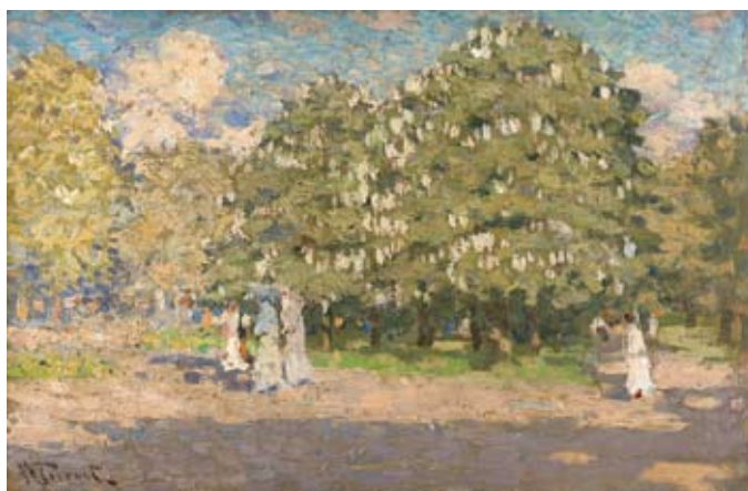
V. PURVĪTIS „Ziedošās kastaņas” ap1908.