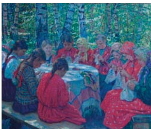
N.B. BEĻSKIS "Rokdarbu stunda" 1936.