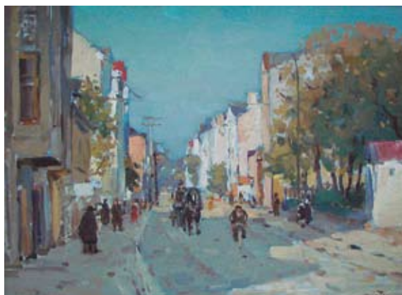
A. FILKA „Hospitāļu iela” 1935.