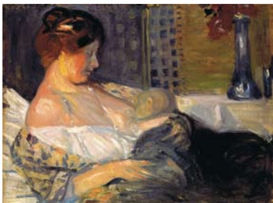
J. ROZENTĀLS „Māte ar bērnu” 1904.