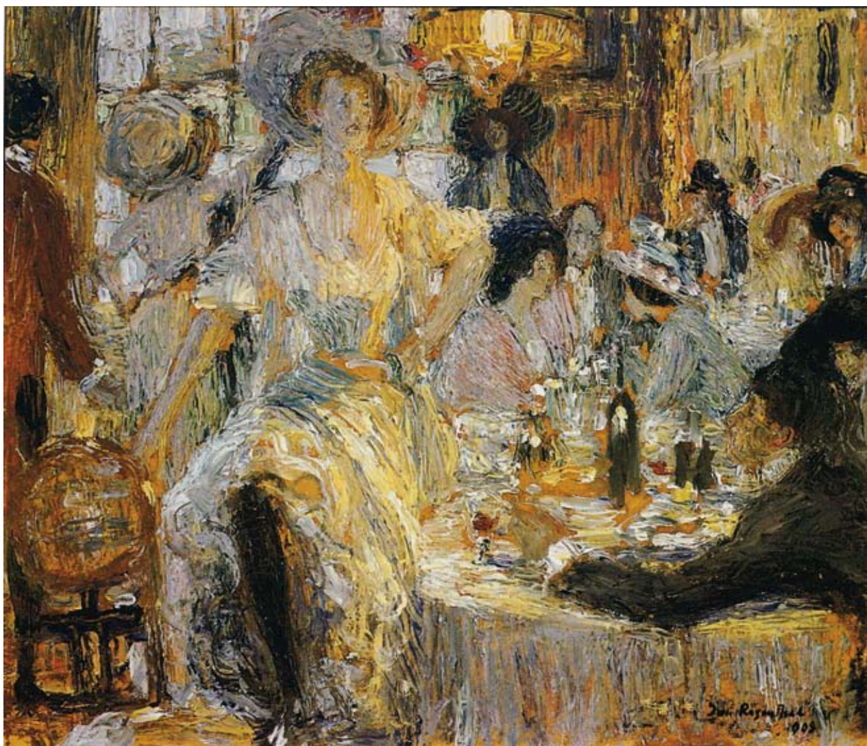
J. ROZENTĀLS " Parīzes kafējnīca" 1908.