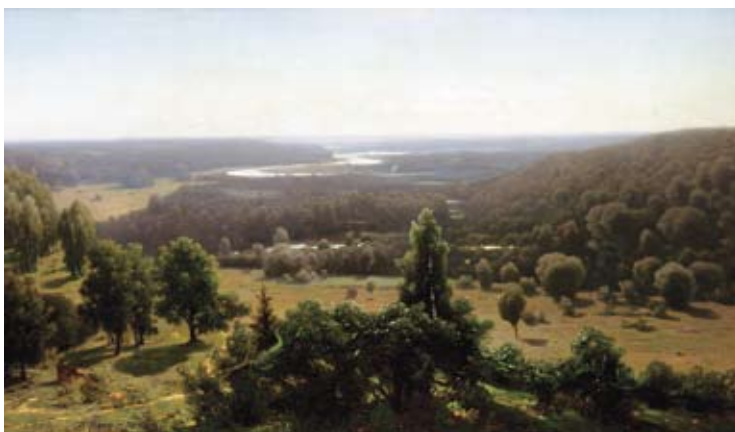
J.Feders” Gaujas leja” 1891.