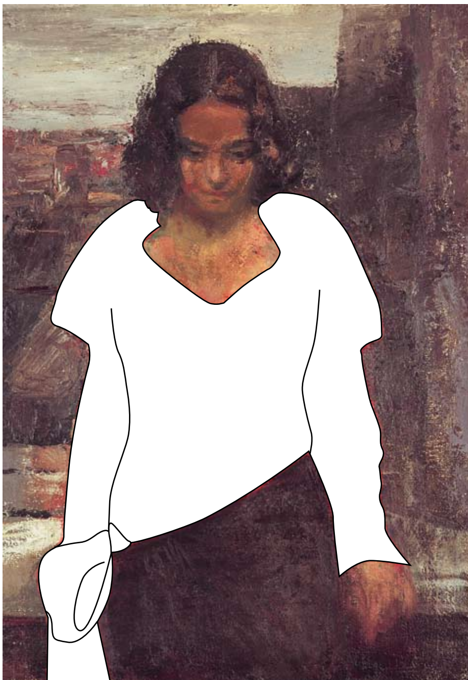
V. TONE „Pie loga” 1932.

Kādā krāsā (rakstā) tu gleznotu šai sievietei blūzi, ja būtu mākslinieks? Izkrāso!