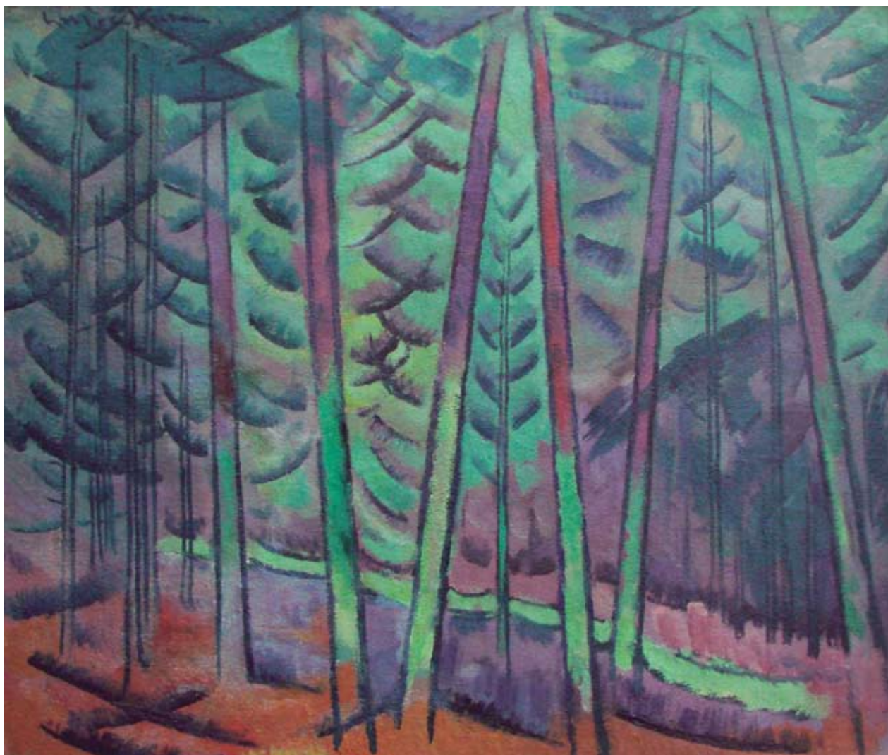
J.VALTERS, „Meža ainava” 20.gs. 20. gadi.