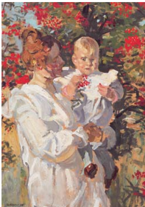
J. ROZENTĀLS „Zem pilādža”1905.

Daudzi krāsas likumi atklājās māksliniekiem praktiskā pieredzē, kad viņi atstāja savu darbnīcu un sāka gleznot plenērā – zem klajas debess. Saules gaismas iespaidā gleznotāji pētīja krāsu likumus un uzstādīja sev jaunu uzdevumu – sasniegt toņu spilgtumu, gaišumu, dzidrumu. Krāsas kļuva intensīvākas, gleznās varēja skatīt ļoti spilgtas gaismas, krāsainas ēnas, kontrastus (piem. zils + dzeltens, zaļš + sarkans) un drošus, brīvus triepienus. Ar tīras krāsas sīkiem otas triepieniem ir iespējams gleznot dzidro, spožo saules gaismu, kas vibrē, sapludinot līnijas un formas.