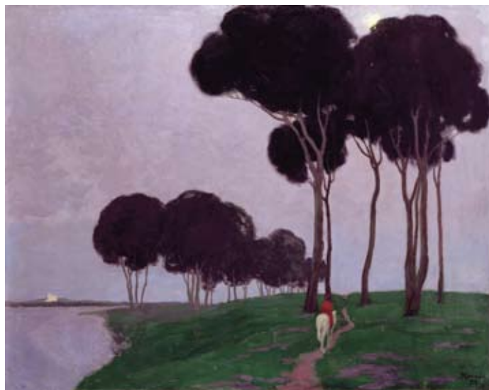
A.ROMANS „Ainava ar jātnieku” 1910.

5. Iztēlojies, ka A. Romana darbā „Ainava ar jātnieku” ir dienas vidus un spīd spoža saule! Uzzīmē, kā tas varētu izskatīties!