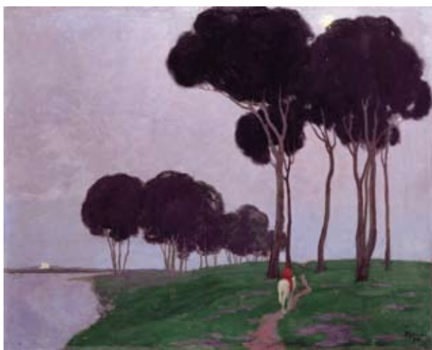
A. ROMANS „Ainava ar jātnieku” 1910.