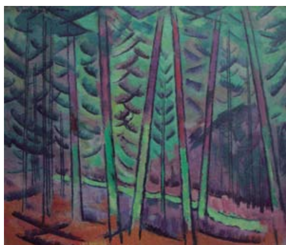
J. VALTERS „Meža ainava” 20.gs. 20.gadi.